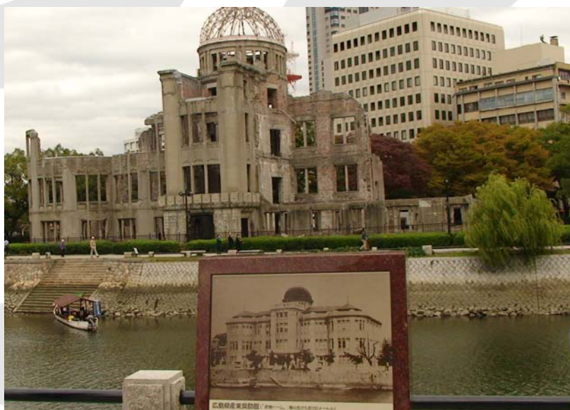
Зграда од цигала коју су Јапанци одлучили да буде сачувана као опомена будућим генерацијама

У Меморијалном центру (парк и музеј) нисам био први пут и опет нисам остао равнодушан. Тужна је прича, па је нећу начињати. Написаћу само толико да је данас био радни дан а да сам видео десетине аутобса паркираних у околини комплекса који су чекали да обилазак заврше посетиоци, углавном униформисани ђаци основних и средњих школа.