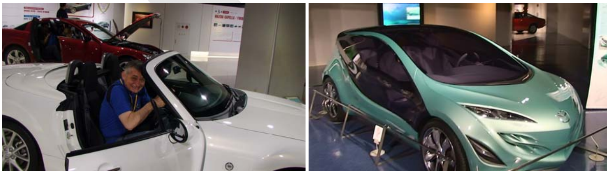
У „Маздином“ музеју у Хирошими

У „Мазди“ смо сазнали да је то трећа/четврта јапанска аутомобилска компанија по броју произведених аутомобила (највећа је „Тојота“, следи „Хонда“, „Мазда“ је на итом нивоу као „Нисан“, а иза њих је „Мицубиши“). За производњу једног аутомобила треба им 15 сати, у једној смени ради само 500 радника јер је доста процеса роботизовано и – сваки запослени на посао долази „Маздом“, чак и они са врха менаџмента. Видели смо ауто који ће тржишту бити понуђен половином идуће године, са безинским мотором којим ћете са литром горива моћи да пређете 32 км, коа и пар модела са водониковим мотором.