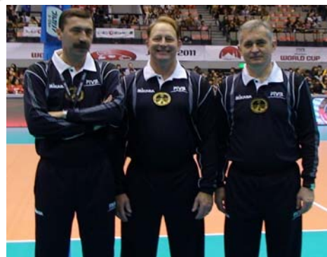
Униформе: сад и никад више овакве?