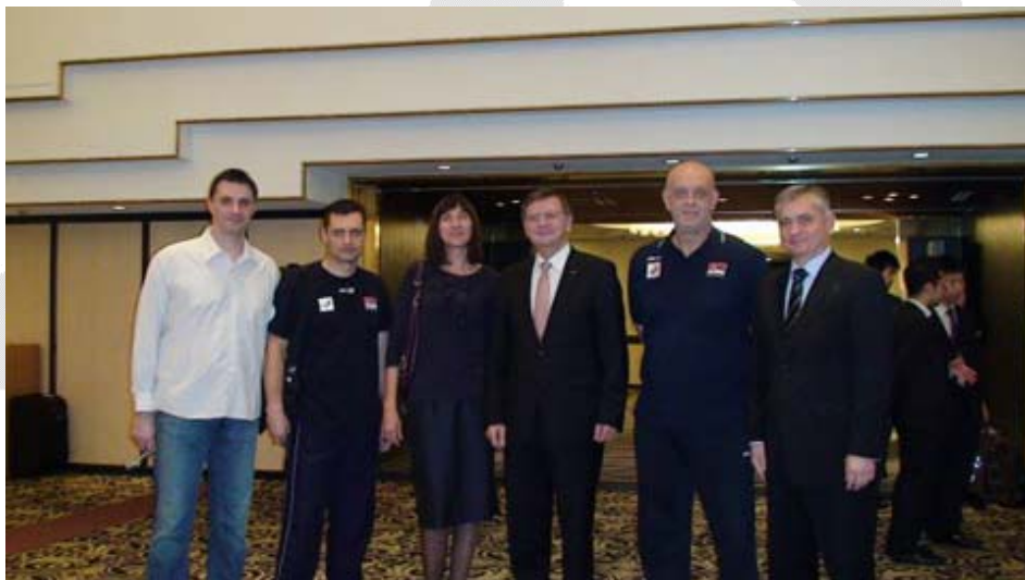
Срби, пред састанак уочи последње фазе Светског купа у Токију

И тако, ето, дође и крај овом Светском купу. Вечерас ћу судити као други судија утакмицу Јапан – САД, заједно са Зеновичем. Моје оцене од стране контролора суђења са њиховим коментарима прилажем на крају.