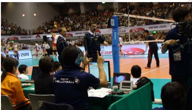
Протокол је прилично дугачак, али о времену брину људи из Фуџи ТВ

На позив председника ЦЕВ Мајера, који је на Светском купу 2011 за жене председник Контролног комитета, заједно са Карин Захорцовом јуче поподне сам био на састанку са представницима „Микасе“ који су задужени за судијску униформу. Пренели смо им судијска искуства са коришћењем униформе коју сте видели на горњим сликама (мајица је урађена са мушким и женским кројем), а која ће, највероватније, бити измењена за следећа ФИВБ-такмичења. Да ли ће и када судијска униформа измењеног дизајна постати обавезна за све међународне судије – о томе није било речи на јучерашњем састанку. Разговарали смо о материјалу, линији панталона, употреби каиша, изгледу џепова, дизајну, мушком и женском кроју мајица..